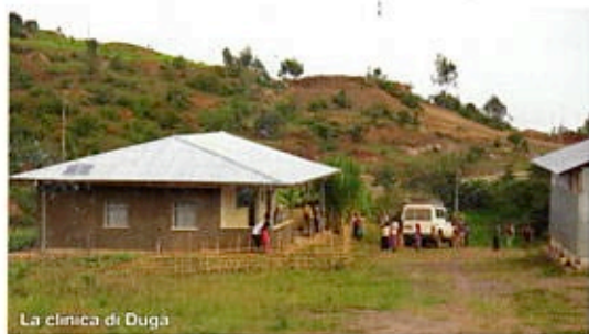
La clinica di Duga

Ora Raffaello riposa vicino alla chiesetta di Duga, per sua volontà. Grazie per la tua testimonianza, piccolo grande missionario!